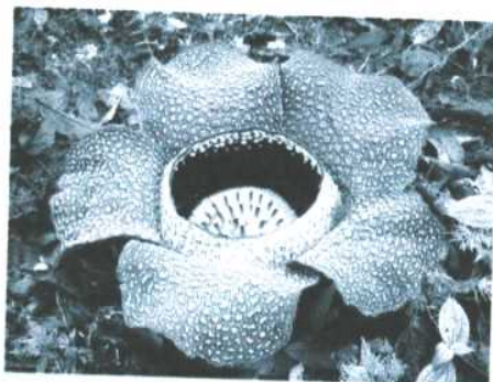
А) Раффлезия +